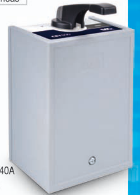
CET-800 40A Alavanca