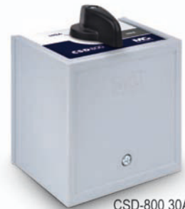
CSD-800 30A Knob