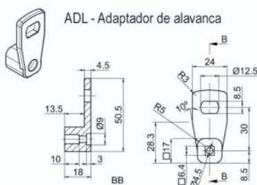
ADL - Adaptador de alavanca