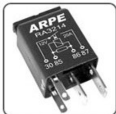
RA3214 - FIAT, GM, VW MINI RELÉ AUXILIAR BOMBA DE COMBUSTIVEL - 2 TERMINAIS 2,8 MM - 12V 20A