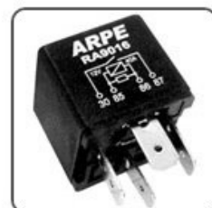
RA9016 - GM RELÉ BOMBA COMBUSTIVEL CIRCUITO ELETR. DE PROTEÇÃO - INVERTIDO 12V 40A