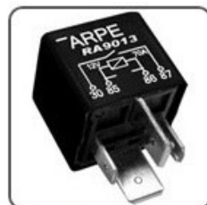
RA9013 - GM MÓDULO ELETRÔNICO ECM 12 V 70A - CIRCUITO ELETR. DE PROTEÇÃO AO MÓDULO