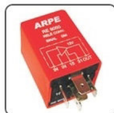
RE9050 - GM RELÉ CONVERSORES DE SINAL DO VELOCIMETRO - 12V - ORIGINAL