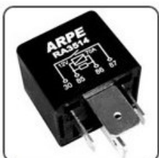
RA3514 VW RELÉ ALÍVIO CORTE DE CARGA - 12V 70A