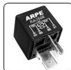
RA3508 - VW RELÉ AUX. POTÊNCIA ALÍVIO E CORTE DE CARGA NA PARTIDA - CENTRAL 12V 70A