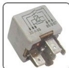
RA9022 - GM RELÉ AUX. INJEÇÃO ELETRÔNICA DUPLO NA 12V 20/12A, 6 TERMINAIS