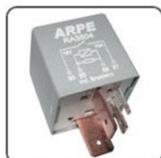
RA3504 - VW RELÉ DA BOMBA DE COMBUSTIVEL CIRCUITO ELET. DE PROTEÇÃO - 12V 70A - ORIGINAL