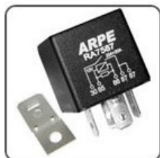
RA7587S - FIAT, PEUGEOT RELÉ SISTEMA DE INJ. ELETR. SPI MPI RELES AUX. DUPLO 87 (NA) 20-20A 12V 20-20 TERMINAIS DE 6,3 MM