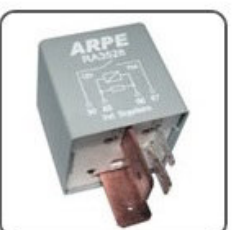
RA3526 - VW RELÉ BOMBA DE COMBUSTIVEL SISTEMA DE INJEÇÃO - 12V 70A - ORIGINAL