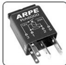
RA6000 - FORD RELÉ AUXILIARES MINI NA BOMBA COMBUSTIVEL - 12V 20A