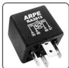
RA3512 - VW RELÉ BOMBA COMBUSTIVEL - SIS. INJ. ELETR. CIRCUITO ELETR. PROTEÇÃO - 12V 40A