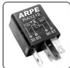
RA3212 - FIAT, GM MINI RELÉ AUXILIAR DA BOMBA DE COMBUSTIVEL - 12V 30A