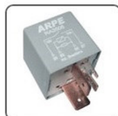
RA3506 - VW RELÉ DA BOMBA DE COMBUSTIVEL CIRCUITO ELETR. DE PROTEÇÃO 12V 70A - ORIGINAL