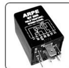
RT200 - FIAT, FORD, GM, VW RELÉ TEMPORIZADOR COMANDO DA INJ. ELETR. - SISTEMA MOTRONIC - 12V 40A