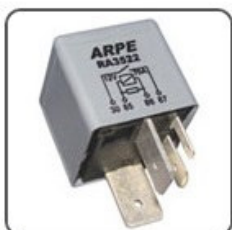
RA3522 - VW RELÉ ALÍVIO CORTE DE CARGA - 12V 70A - ORIGINAL