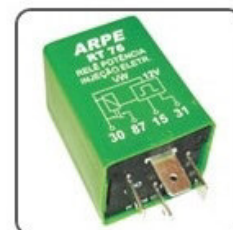
RT76 - VW RELÉ TEMPORIZADOR DE POTÊNCIA BOMBA ELÉTRICA DA INJEÇÃO - 12V 40A - ORIGINAL