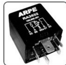
RA3532 - VW RELÉ SISTEMA INJEÇÃO ELETRÔNICA - 12V 40A