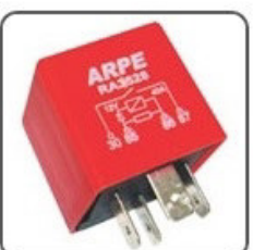
RA3528 - VW RELÉ BOMBA COMBUSTIVEL CIRCUITO ELETR. DE PROT. - MÓDULO - 12V 40A - ORIGINAL