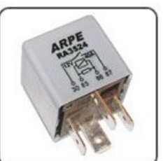
RA3524 - VW RELÉ BLOQUEADOR DE IGNIÇÃO CIRCUITO ELETR. PROTEÇÃO - 12V 40A - ORIGINAL