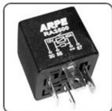
RA3500 - VW RELÉ DA BOMBA DE COMBUSTIVEL CIRCUITO ELETR. DE PROTEÇÃO - 12V 40A