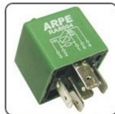
RA6004 - FORD RELÉ SISTEMA INJ. ELETRÔNICA CORTE DE IGNIÇÃO 12V 40/30A NA/NF - ORIGINAL