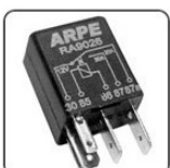
RA9026 - FIAT, GM RELE AUXILIAR MINI REVERSÍVEL 12V 30/20A, 2 TERMINAIS 2,8MM