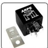
RA1512S - VÁRIOS CLIENTES RELE AUXILIAR VENTILAÇÃO E AR CONDICIONADO - 40/30A - 12V