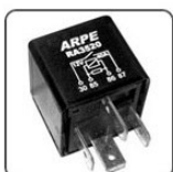
RA3520 - VW RELE AUXILIAR DE AR CONDICIONADO - 12V 40A