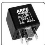
RA9007 - GM RELE SISTEMA VENTILADORA RADIADOR CIRCUITO ELET. DE PROT. - 12V 40/30A