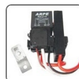
RAC1712S - UNIVERSAL PORTA RELE DE COMANDO DO AR CONDICIONADO - 12V 70A