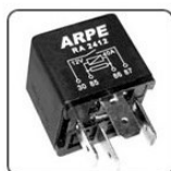
RA2412S - FORD, GM RELE PARA SISTEMA DE VENTIL. - TIPO INVERTIDO - 12V 40A