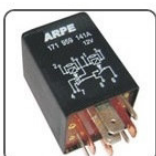
RA3534 - VW RELE DE COMANDO DO AR CONDICIONADO - 12V 40A