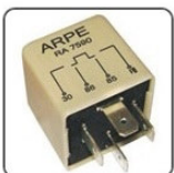
RA7590 - FIAT RELE DE COMANDO DO AR CONDICIONADO - 12V 30/30A