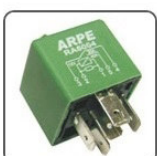
RA6004 - FORD RELE DO AR CONDICIONADO - 12V 40/30A