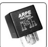
RA7500 - FIAT RELE DO COMPRESSOR DO AR CONDIC. - SAÍDA COMUM - 12V 30/30A