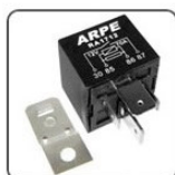
RA1712S - VÁRIOS CLIENTES RELE AUXILIAR VENTILAÇÃO E AR CONDICIONADO - 70A - 12V