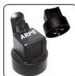
RA1212 - PEUGEOT, RENAULT RELE AUXILIAR AR CONDICIONADO ELETROVENTILADOR / FARÓIS AUXILIARES - 12V 26/16A