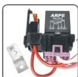
RAC1512S - UNIVERSAL PORTA RELE DO AR CONDICIONADO 40/30A 6 TERM. - 12V