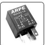
RA9018 - GM RELE MINI AUXILIAR VENTILADORA SEM AR, CIRCUITO ELET. DE PROT. - 12V 20A 2 TERMINAIS DE 2,8MM