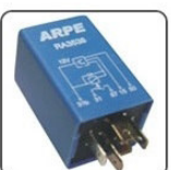
RA3538 - FORD, VW RELE DE COMANDO DO AR CONDICIONADO - 12V 40A