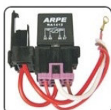
RAC1412S - UNIVERSAL PORTA RELE DO AR CONDICIONADO 40A 4 TERM. - 12V