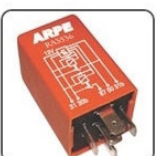
RA3536 - FORD, VW RELE DE COMANDO DO AR CONDICIONADO - 12V 40A