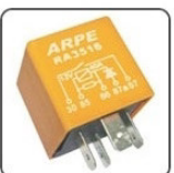
RA3516 - VW RELE ACONDICIONAMENTO VENTILADORA E AR CONDIC. - CIRC. PROTEÇÃO - 12V 40A