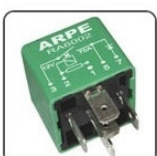
RA6002 - FORD RELE DE CONTROLE DA VENTILADORA DO AR CONDICIONADO - 12V 70A, 6 TERMINAIS SENDO 1 DE 2,8 MM