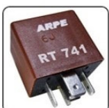
RT741 - FIAT RELE TEMPORIZADOR DO AR CONDICIONADO E VENTILADORA - 12V