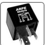
RA3510 - VW RELE AUXILIAR VENTILADOR E AR CONDICIONADO - 12V 40A