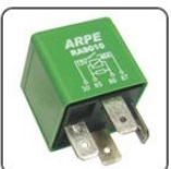
RA9010 - GM RELE SISTEMA VENTILAÇÃO E AR COND. - TIPO INVERTIDO - 12V 40A