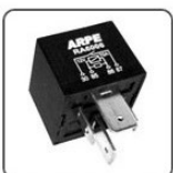
RA6006 - FORD RELE VENTILADOR 2A VELOCIDADE - 12V 70A