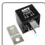
RA2512S - GM, RENAULT, VW RELE AUXILIAR DE AR CONDICIONADO - 60A - 12V