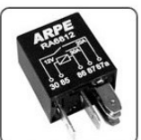
RA6812 - FIAT RELE MINI AUXILIAR AR CONDICIONADO - 12V 30/20A