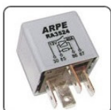
RA3524 - VW RELE SISTEMA DA VENTILADORA DO RADIADOR - CIRCUITO ELET. - 12V 40A - ORIGINAL