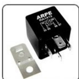
RA1412S - VÁRIOS CLIENTES RELE AUXILIAR VENTILAÇÃO E AR CONDICIONADO - 40A - 12V