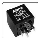
RT742 - FIAT RELE TEMPORIZADOR ALÍVIO CORTE DE CARGA AR CONDICIONADO - 12V