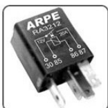
RA3212 - FIAT, GM RELE AUXILIAR MINI DO VENTILADOR NA 12V 30A