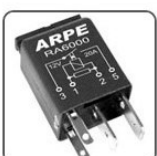
RA6000 - FORD RELE MINI AUXILIAR AR CONDICIONADO E VENTILAÇÃO - 12V 20A SENDO 2 TERMINAIS 2,8MM