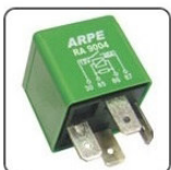
RA9004 - GM RELE DE AR CONDICIONADO E VENTIL. - TIPO INVERTIDO - 12V 40A