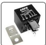
RA7712S - UNIVERSAL RELE AUXILIAR VENTILAÇÃO E AR CONDICIONADO 6 TERM. - 70/70A - 12V