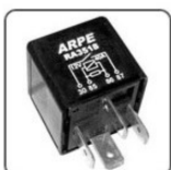
RA3518 - VW RELE ACONDICIONAMENTO PRIMEIRA VELOCIDADE DA VENTILADORA - 12V 40A